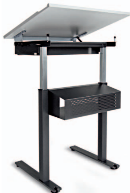
1-er Pult Mod. S 4301, Zweisäuler