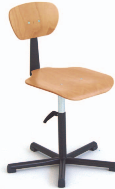
Stuhl Mod. T 6005, Inbus