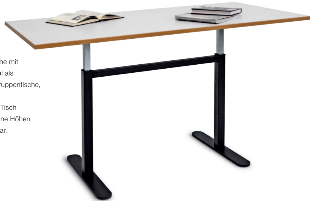
Gruppentisch S 4160 Lifthöhenverstellung

Universal einsetzbare Tische mit Schnellverstellung. Optimal als Therapie-, Lehrer- oder Gruppentische, in Sekunden verstellt und trotzdem so stabil wie ein Tisch mit fixer Höhe. Verschiedene Höhen und Plattengrößen lieferbar.