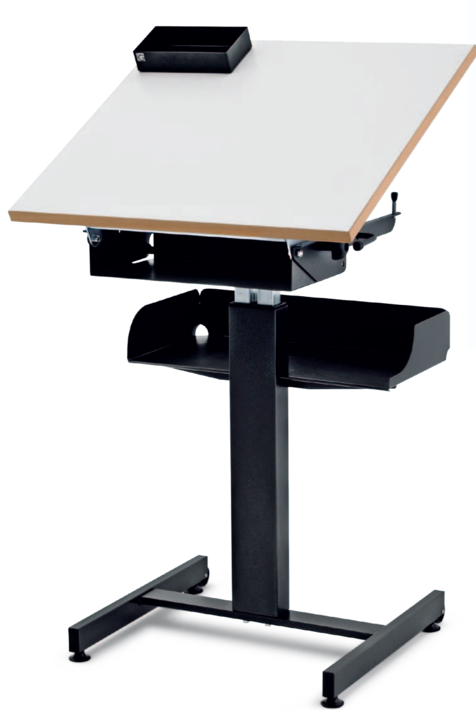
1-er Pult Mod. S 4111, Duosäuler

Pulte mit Schnellverstellung, für Arbeiten im Sitzen und Stehen. Maximale Bedienungsfreundlichkeit vereint mit höchster Stabilität. Verschiedene Ausführungsvarianten für alle Anwendungen im Baukastensystem kombinierbar.