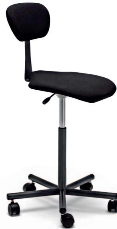
Stuhl Mod. T 6005, Lift Polster