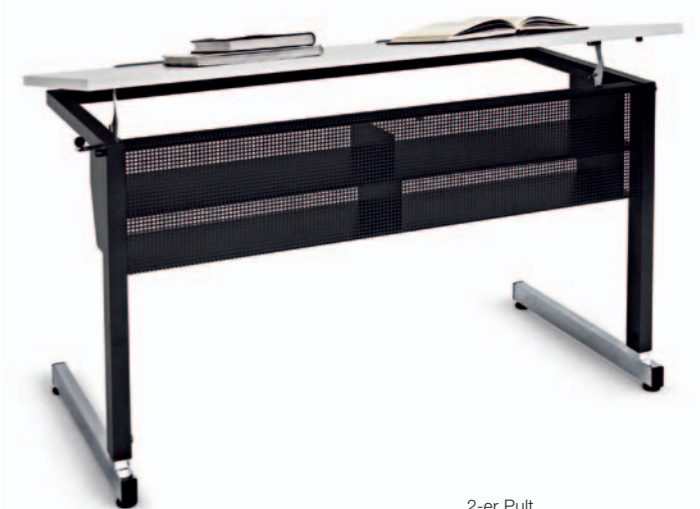
2-er Pult Mod. G 4201