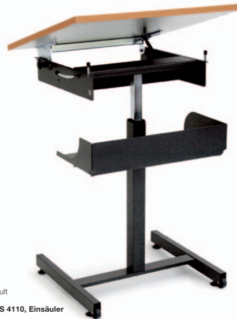
1-er Pult Mod. S 4110, Einzäuler