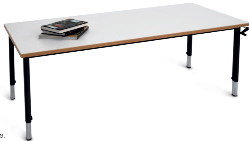
Gruppentisch T 4173 Lifthöhenverstellung

Universal einsetzbare Tische mit Getriebeverstellung. Optimal als Therapie-, Lehrer- oder Gruppentische, bewährte Getriebeverstellung mit fixer, ausziehbarer Kurbel. Verschiedene Höhen und Plattengrößen lieferbar.