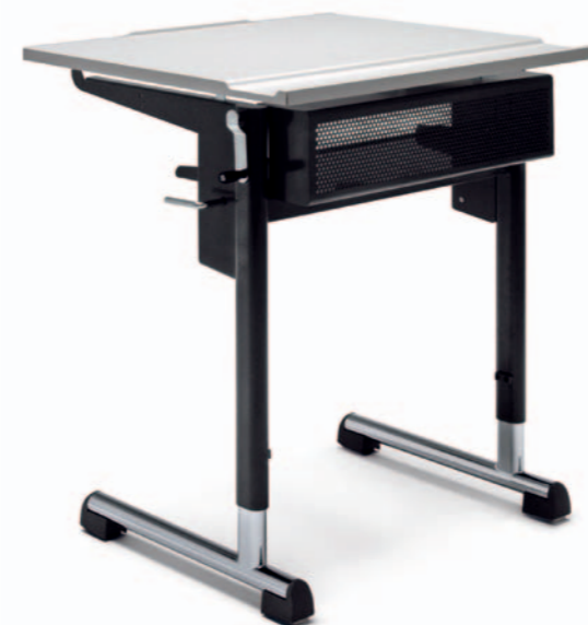
1-er Pult Mod. T 4102

Verstellbereiche und viele Ausstattungsmöglichkeiten. Als 1-er und 2-er Pult lieferbar.