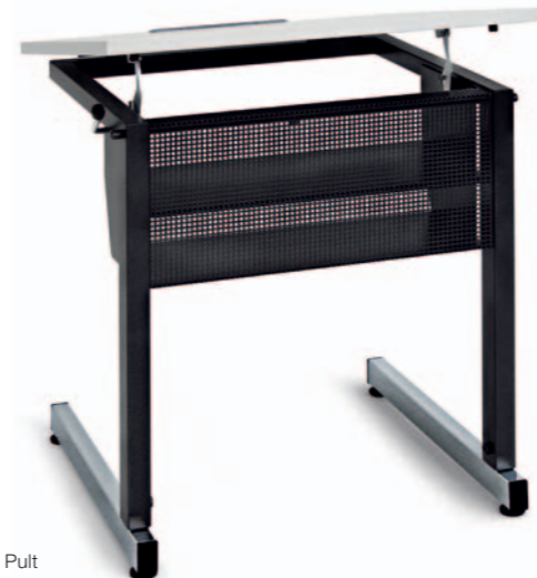
1-er Pult Mod. G 4101

Verstellbereiche und viele Ausstattungsmöglichkeiten. Als 1-er und 2-er Pult lieferbar.