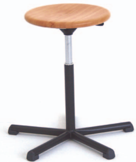
Hocker Mod. T 7005, Lift