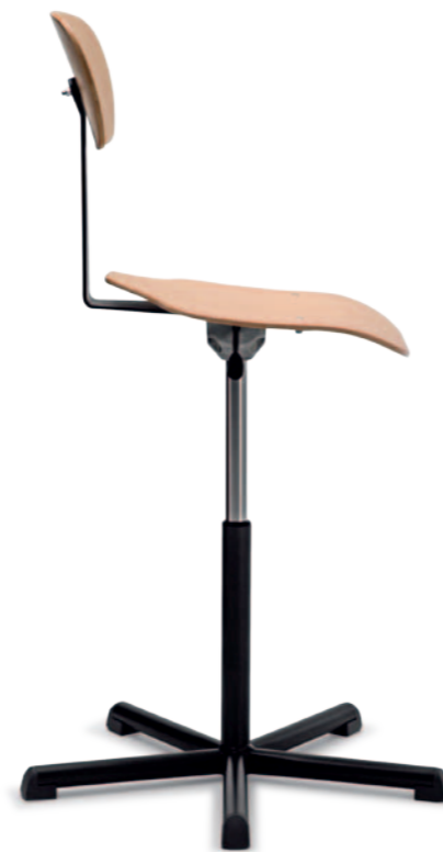
Stuhl Mod. T 6005, Lift

Ergonomische Schulstühle mit hervorragendem Komfort. Stabile, rückschonende Sitzhaltung dank speziell geformten Holzteilen. Verschiedene Höhen und Federstärken für alle Schulstufen. Sternfüsse in zwei Ausführungsvarianten, auch mit Polsterung oder Rollen lieferbar.