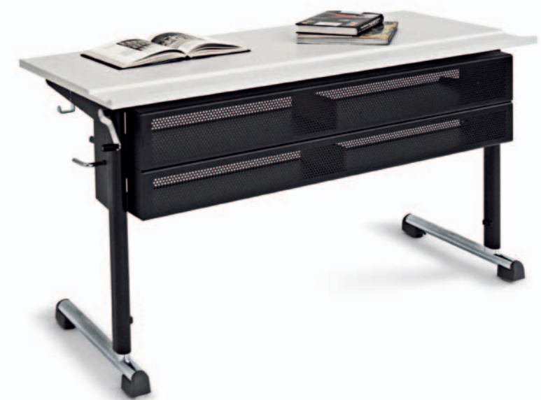
2-er Pult Mod. T 4202