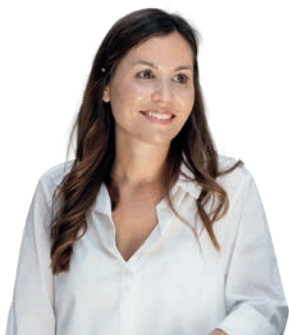
Cinzia Palmiero Interior Design, Dyer-Smith SA

«Grâce à une équipe experte, tous ces travaux de très haute qualité ont été réalisés de manière très rapide par GLAESER. Nous trouvons que l'habillage de l'escalier est tout particulièrement réussi.»